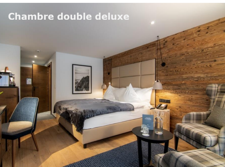
Chambre double deluxe